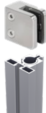
Modular gedacht für individuelle Design-Lösungen: Der Trias-Basispfosten passt dank unterschiedlichster Anbaumodule für alle Füllungen.