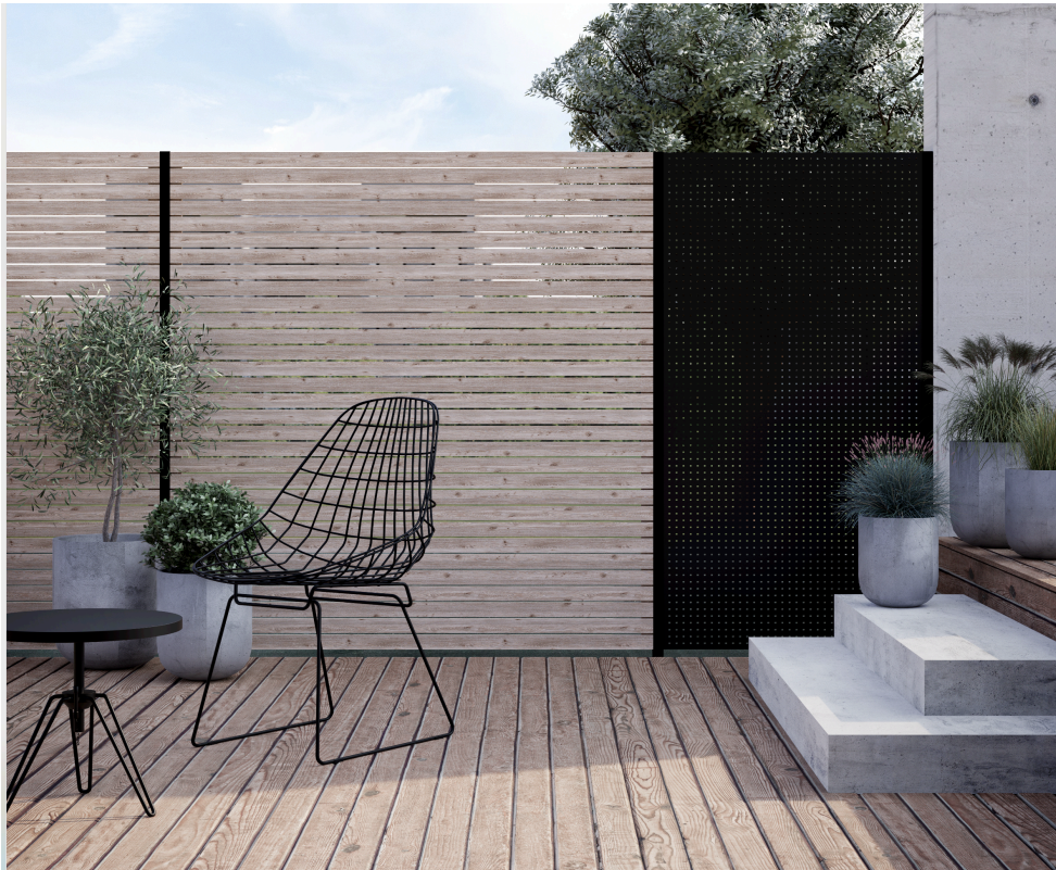
Sichtschutz-Design, das zum individuellen Baustil passt dank modularem Kombisystem von Trias.