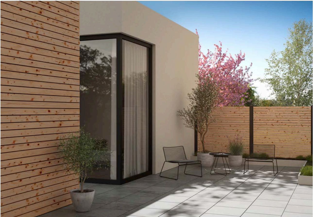
Rhombusleisten aus Aluminium in Holzoptik von TRIAS sind dekorativ und pflegeleicht